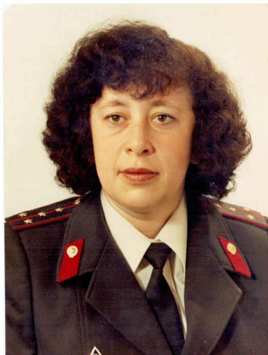
Капитан милиции. Начало 1980-х годов