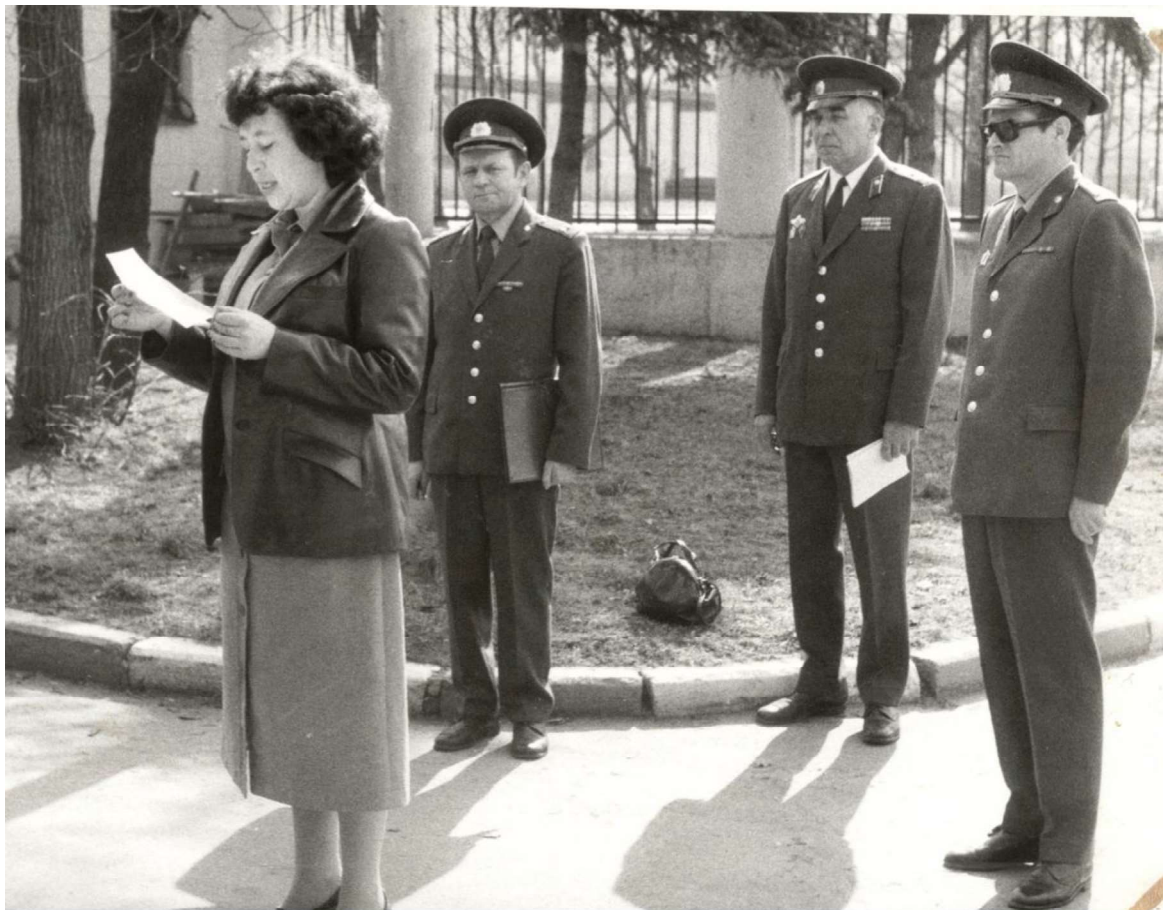
Присяга сотрудника ОВД. 1980 г.